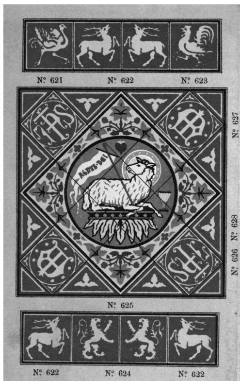
Kirchendekoration aus einem Musterkatalog

Die Bestimmung historischer Fliesen allein und das Auffinden von erhaltenen Beständen genügt jedoch nicht. Die Firmengeschichte lebt von den Menschen, die in der Plattenfabrik gearbeitet haben, ja teilweise über Generationen mit dem Werk in Sinzig verbunden sind. Sie zu gewinnen, an diesem ehrgeizigen Projekt mitzuwirken, ist unser Anliegen. Ende Januar 2010, trotz des tiefen Schneechaos, führte es 16 ehemalige Mitarbeiterinnen und Mitarbeiter ins Sinziger Schloss. Dem ersten Gedankenaustausch sind inzwischen viele Befragungen gefolgt, die wichtige Erkenntnisse liefern über Produktionsverfahren, Arbeitsverhältnisse, den Vertrieb, die Mitarbeiterstrukturen, das soziale