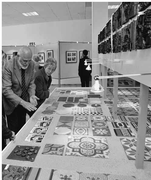
Blick in die Ausstellung, die in der Werkskantine im September 2010 präsentiert wurde.

Heiß gebrannt bei über 1000 Grad und unverwundlich, das zeigt sich an den vielen gut erhal-