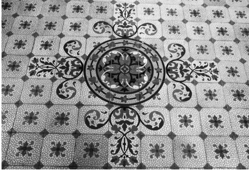
Fußboden (Detail) im Altgebäude der Kreisverwaltung Ahrweiler von 1894

schen Steinzeug Sinzig, die in erweiterter Form ab Mai 2011 im Heimatmuseum Sinzig präsentiert und dann ergänzt werden wird durch den Ausstellungskatalog „ Heiß gebrannt und unverwüstlich – 140 Jahre Fliesen aus Sinzig “ 14 .