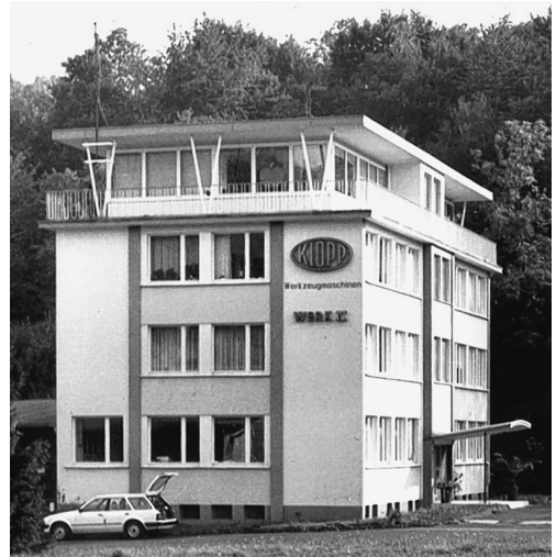
Das Verwaltungsgebäude wurde 1958/59 im „International Style“ erbaut.

Außergewöhnlich in der Eifel um Schalkenbach ist das bis heute bestehende Verwaltungsge-