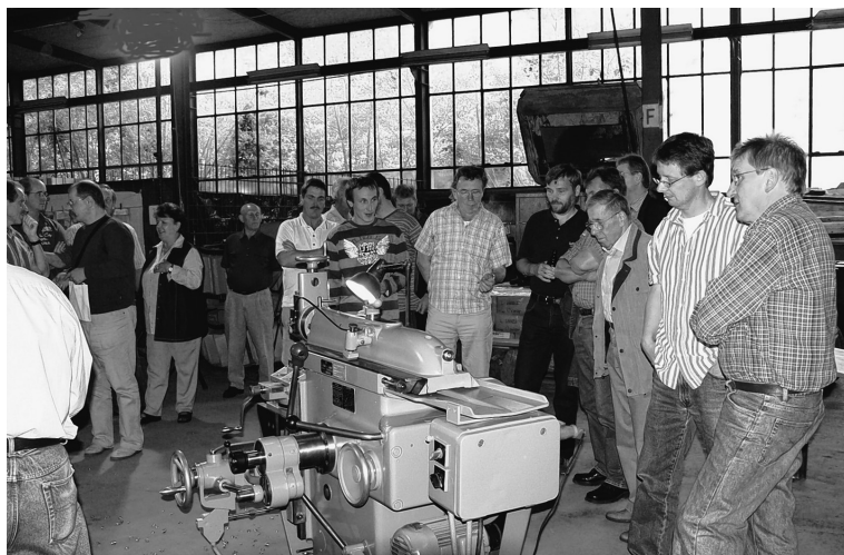
Bei einem Wiedersehen bewundern die „Ehemaligen“ den Schnellhobler Mod. 550, den sie selbst vor über 30 Jahren gebaut haben.

der Schalkenbacher Spedition, direkt zum Kunden gebracht, später dann auch im gesamten Bundesgebiet. Von den Bahnhöfen in Sinzig und Bad Neuenahr aus wurden Maschinen im Holzverschlag per Bahn verschickt. Die in das europäische Ausland verkauften Maschinen wurden von Spediteuren abgeholt. Nach Übersee gingen die Maschinen in spezielle Seekisten verpackt vom Solinger Hauptwerk aus.